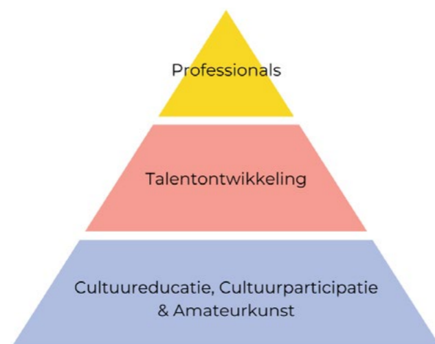
Figuur 1: Weergave van de culturele piramide zoals omschreven in Morgen wacht niet , (pag. 15).

Om aan die persoonlijke voorkeuren te voldoen pleit de provincie Overijssel voor een sterke culturele piramide (Figuur 1). Deze piramide staat niet op zichzelf. Er zijn voor de drie lagen en tussenliggende verbindingen vele organisaties, instellingen en initiatieven in Overijssel. Deze organisaties, instellingen, initiatieven en verbindingen tussen deze drie zullen vanaf dit punt als ecosysteem worden omschreven.